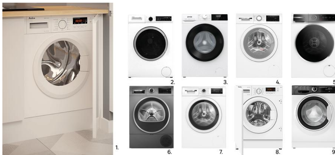
1. Pralka do zabudowy AWBI6122LCB Amica 1 899zł, kod 82466419, 2. Pralka wolnostojąca KFWM 7512 I Kernau 1649 zł, kod 85088478, 3. Pralka wolnostojąca W1NHPI62SCS Gorenje 1539zł/ szt., kod 92224000, 4. Pralka do zabudowy AWBI6122LCB Amica 1899 zł, kod 82466419, 5. Pralka wolnostojąca WGB2440EPL Bosch 6049 zł, kod 91985509, 6. Suszarka wolnostojąca WQG233DRPL Bosch 4299 zł, kod 91985912, 7. Pralka wolnostojąca WAN2813GPL Bosch 2399zł, kod 91985511, 8. Pralka do zabudowy AWBI6122LCB Amica 1899 zł, kod 82466419, 9. Pralka wolnostojąca WRBSS 6249 S EU Whirlpool 1789 zł, kod 91346996

pod uwagę ewentualny zakup suszarki bębnowej . Urządzenie to można ustawić obok pralki lub w słupku. Jest to bardzo funkcjonalne rozwiązanie, zwłaszcza wtedy, gdy pralka jest niewielkich rozmiarów i zależy nam na ograniczeniu przestrzeni. W takim przypadku suszarkę stawiamy na pralce, gdyż jest lżejsza. Suszarki przydają się szczególnie w domach gdzie są dzieci i zwierzęta, oraz wszędzie tam, gdzie jest ograniczona przestrzeń na rozwieszanie odzieży. Nowe ekonomiczne modele suszarek nie zużywają wiele energii elektrycznej.