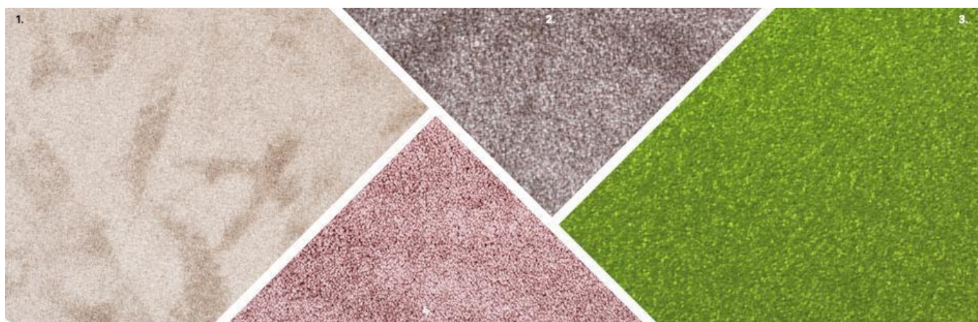
1. Wykładzina dywanowa MultiSense Maya beżowa S 4 m. 78,99 zł/m 2 2. Wykładzina dywanowa MultiSense Camilla brązowa S 4 m. 89 zł/m 2 3. Wykładzina dywanowa Dakota zielona S 4 m. 41,49 zł. 3. Wykładzina dywanowa MultiSense Maya różowa S 4 m. 78,99 zł/m 2

Miękkie i stosunkowo łatwe w utrzymaniu w czystości wykładziny dywanowe charakteryzują się dobrymi właściwościami izolacyjnymi i akustycznymi. Są przy tym łatwe do samodzielnego ułożenia. Doskonale sprawdzą się w sypialni lub pokoju dzieciennym, izolując nas od hałaśliwych sąsiadów. Niestety mają też wady: podobnie jak dywany nie nadają się do domu alergika. Wykładziny dywanowe oznaczone są dwucyfrową liczbą, w której pierwsza oznacza przeznaczenie produktu, a druga wskazuje klasę wytrzymałości. Wykładziny oznaczone liczbami 21, 22, 23 nadają się do użytku w domu, a 31,32,33 – do obiektów użyteczności publicznej.