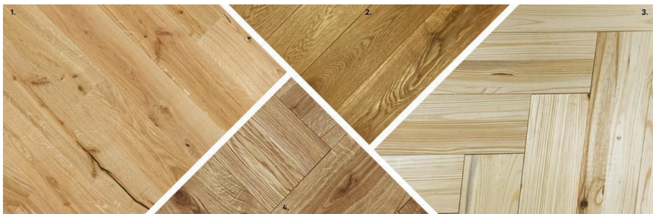
1. Deska trójwarstwowa dąb vintage 13 x 72,5 cm 145 zł/m 2 2. Deska lita dąb 11 x 120 cm 215 zł/m 2 3. Deska warstwowa jodełka sosnowa 12 x 60 cm 129 zł/m 2 4. Deska warstwowa mozaika dąb 19 x 38 cm 249 zł/m 2

Drewno jest nadal niezastąpionym, lubianym materiałem do wykończenia podłóg. Jest trwałe, ciepłe i naturalne. Starannie pielęgnowane może nam służyć przez lata. Nadaje się do powtórnego przetworzenia. Podłogi drewniane są eleganckie, długo trzymają ciepło i mają właściwości antystatyczne. Decydując się na taką podłogę wybierzmy odpowiednią do pomieszczenia klasę ścieralności i unikajmy pomieszczeń wilgotnych. Drewno tego nie lubi. Dąb w różnych wybarwieniach i inne gatunki rodzimego drewna przeżywają swój renesans z powodzeniem zastępując połogi z drewna egzotycznego.