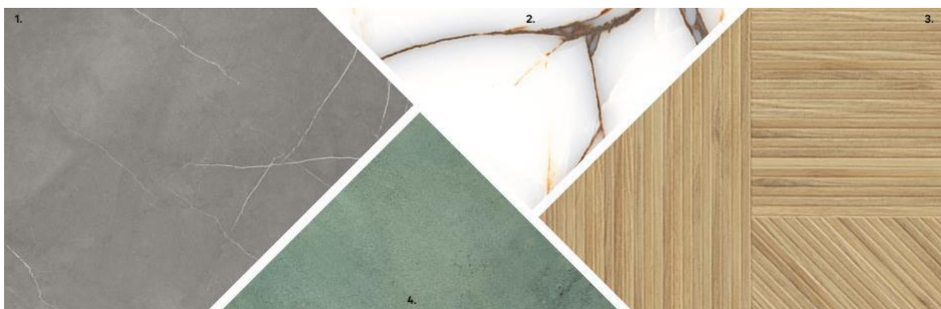
1. Gres szkliony Pulpis Poler szary 60 x 60 cm 89,99 zł/m 2 2. Gres szkliony Onix biały 60 x 60 cm 129 zł/m 2 3. Gres szkliony Iberia 60 x 60 cm 129 zł/m 2 3. Gres szkliony Kaldera zielony 59,8 x 59,8 cm 139 zł/m 2

Gresy szklione i kamień są doskonałą alternatywą dla drewna, zwłaszcza w pomieszczeniach narażonych na wilgoć i zanieczyszczenia, a więc w kuchni, łazience czy przedpokoju. W coraz bardziej popularnych otwartych przestrzeniach mieszkalnych, gdy łączymy kuchnię z salonem lub salon z tarasem możemy z powodzeniem połączyć kilka rodzajów posadzki wydzielając w ten sposób różne strefy. Możemy też zastosować jeden materiał w całej otwartej przestrzeni zyskując efekt większej przestronności.